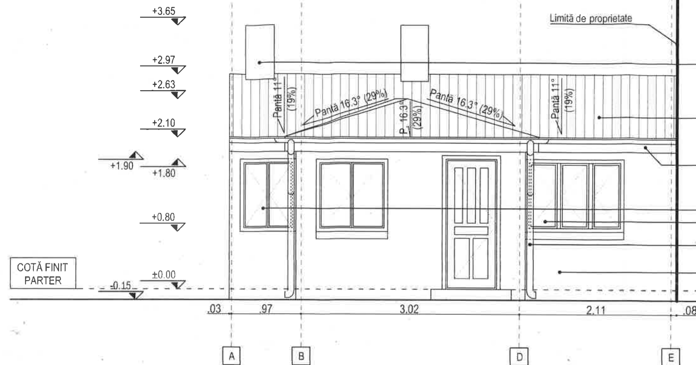
FAȚADĂ SUD-EST (principală)